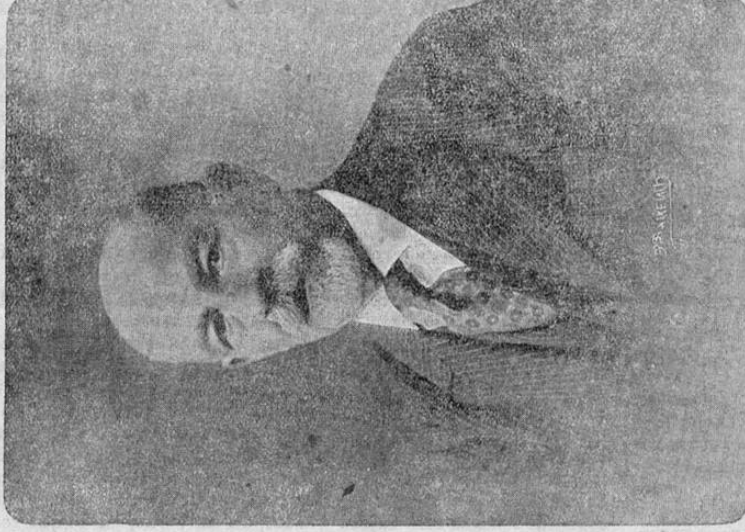
LIC. DON CLETO GONZÁLEZ VÍQUEZ CANDIDATO A LA PRESIDENCIA DE LA REPÚBLICA PARA EL PERÍODO CONSTITUCIONAL DE 1928 A 1932